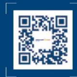
MAP Life App